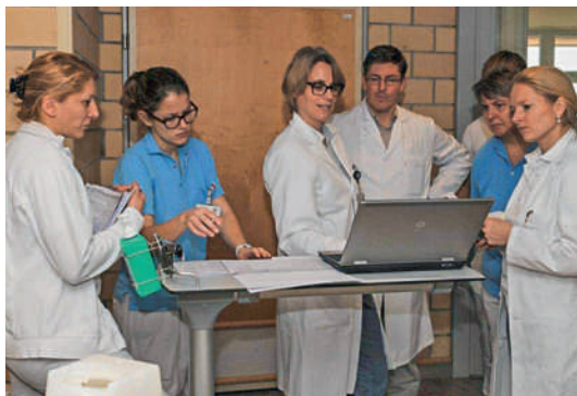
Interdisziplinäre Zusammenarbeit ist entscheidend für eine erfolgreiche Rehabilitation.

renten in die SAR einbezogen. Eine grundlegende und zukunftsweisende Neuerung erfolgte 1983. Die bisher rein ärztliche Arbeitsgemeinschaft wurde zu einem interdisziplinären Gremium, das grundsätzlich allen Rehabilitationsberufen offensteht. Damit wurde die für die Rehabilitation ausschlaggebende Arbeitsweise im multidisziplinären Team in die Praxis umgesetzt. Die SAR blieb auch nicht vor Krisen verschont. Die Beteiligung an den Anlässen der Arbeitsgemeinschaft ging derart stark zurück, dass 1986 ein Antrag zur Auflösung gestellt wurde. Es war in erster Linie der Verdienst des engagierten und überzeugenden Einsatzes des damaligen Präsidenten Profes-